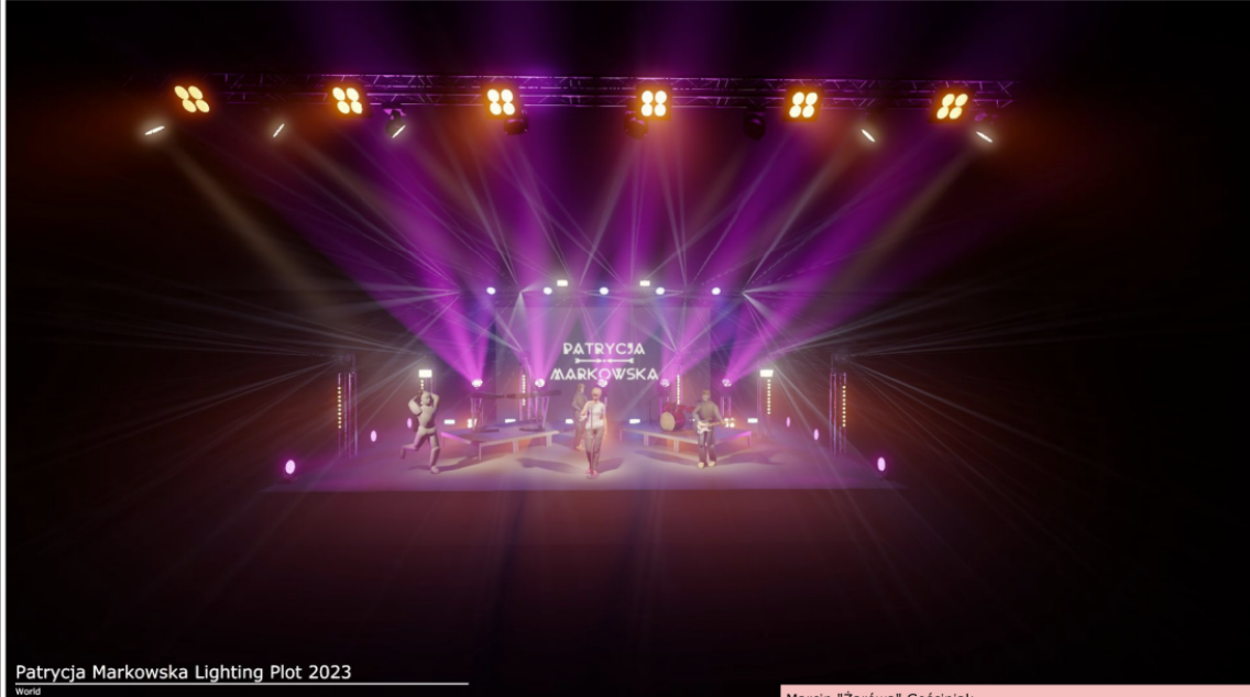
Patrycja Markowska Lighting Plot 2023 World

Drawing author Marcin "Zarowa" Gościński